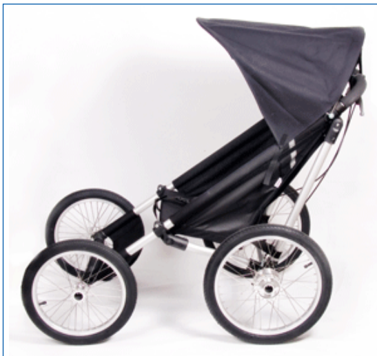
Off Road sulky.