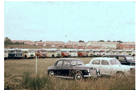
Sommarmötet 1961. Bussar och bilar i långa rader skjutsade medlemmarna till mötet.