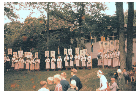
Sommarmötet 1961. Medlemmarna ställer upp sig för att tåga häradsvi i paraden.