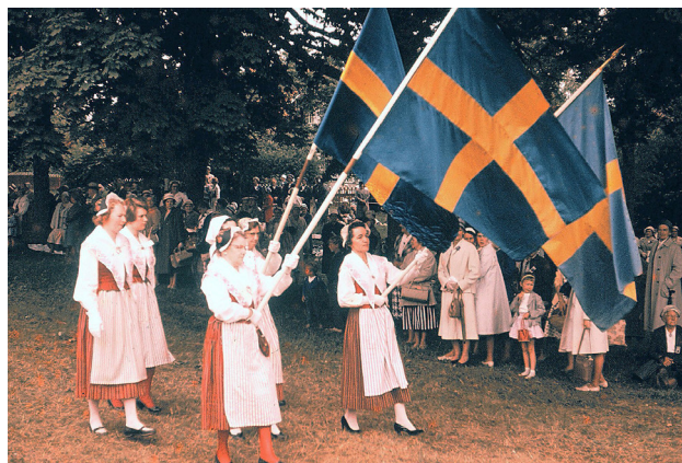
Sommarmötet 1961. Fanborgen går först i paraden av folkdrätsklädda kvinnor.